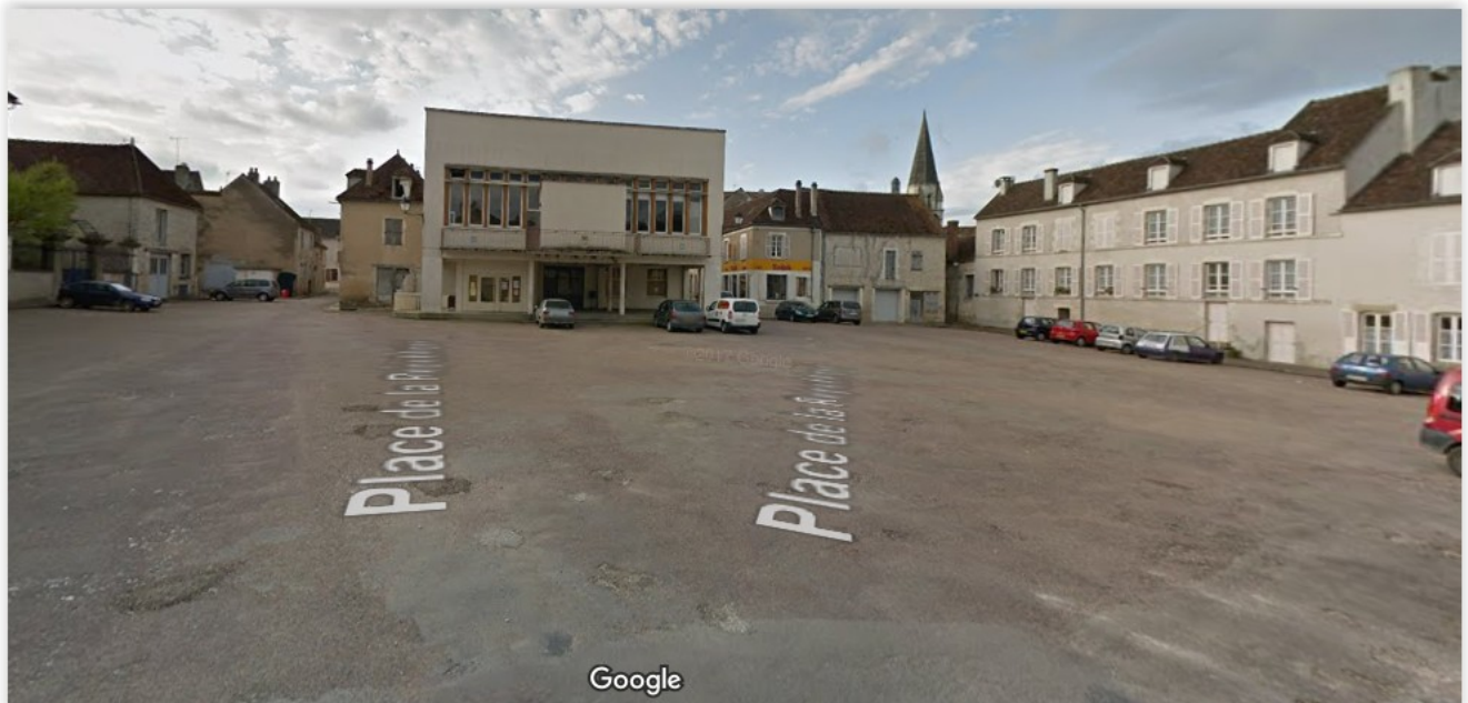
La place de la république avec la salle des Fêtes (salle du marché en dessous).