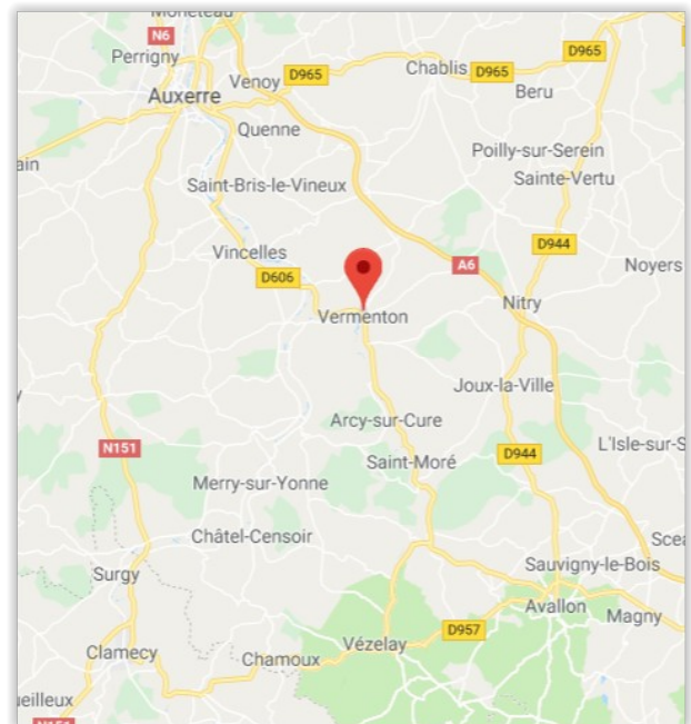
Commune située entre Auxerre et Avallon. Accès par l'autoroute A6, sortie Nity.

Adresse : Salle des fêtes, 2 Place de la République, 89270 VERMENTON.