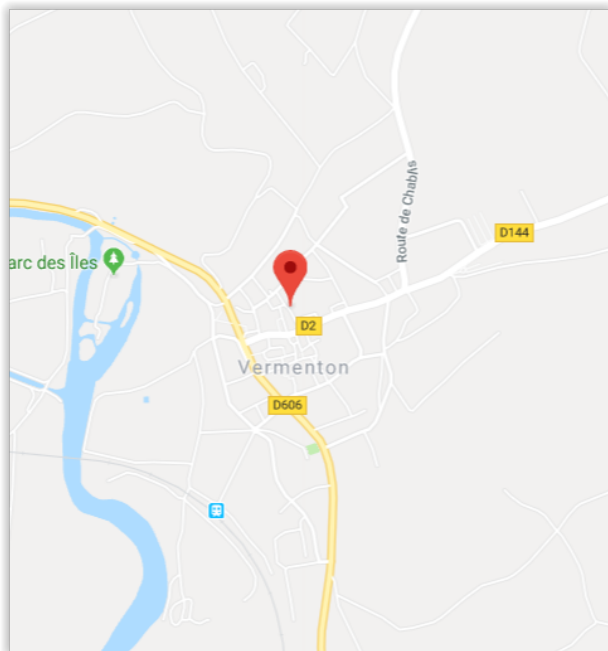
à gauche en montant la rue du Général Leclerc.